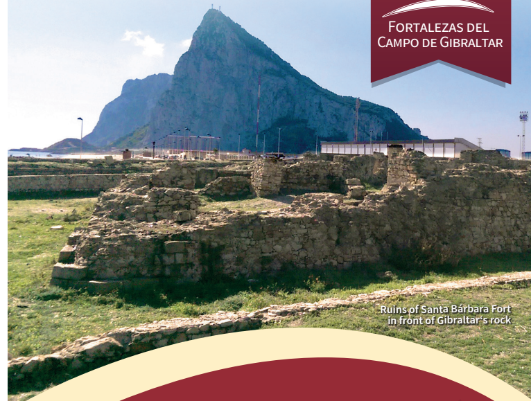
Ruins of Santa Bárbara Fort in front of Gibraltar's rock